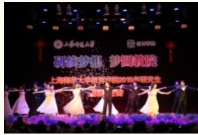
学生节目《爱的华尔兹》