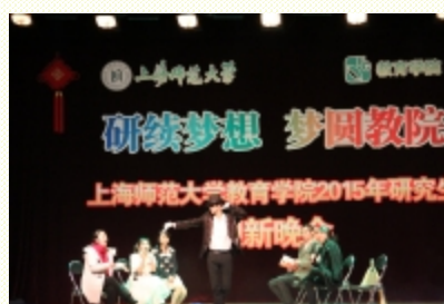
学生小品《男神女神》