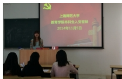
我院首次本科生入党答辩会顺利举行

标志着我院本科生入党答辩制度在我院正式实行。根据校党委要求和精神,为保证新党员质量,加强和改进发展大学生党员工作,我院将进一步完善和推行入党答辩制,加强本科生党员发展制度化建设。