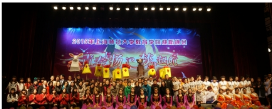
教育学院 2015 年迎新晚会

充满欢笑与幸福的2014。各位专业课老师纷纷登场,展现了平日中深藏不露的高超才艺,引得台下欢呼连连。木偶社的《积木鸡》轻松欢快,让人感悟协作的重要性。美声歌曲《小河淌水》使人仿佛置身那秀丽山河中,悦耳之声堪比天籁。武术《少年中国》振奋人心,少年强,则国强!