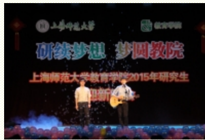
男生二重唱《找自己》