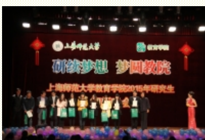
研究生优秀学子颁奖