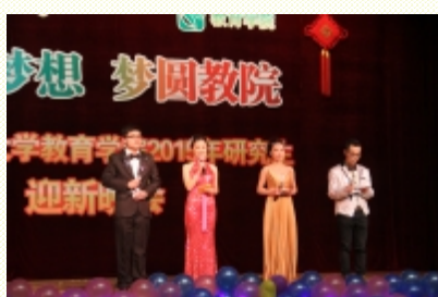
迎新会主持人亮相