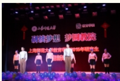
舞蹈《失恋阵线联盟》