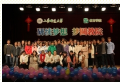
学院领导和演职人员合影